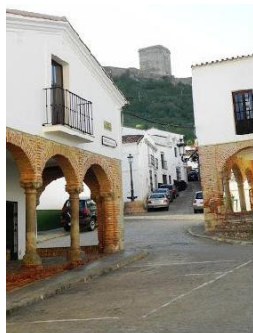
Plaza de España

RECORRIDO: Salimos de la Plaza de España, bajamos la calleja Montero, dirección calle Mártires. Seguimos la calle hasta el final, donde nos encontraremos la Ermita de los Santos Mártires del S.XVIII. Avanzamos unos metros y nos encontramos un cruce que seguimos de frente dirección Burguillos.