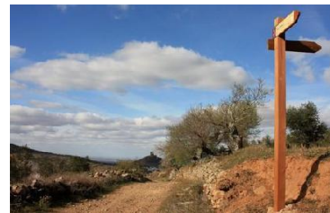
Puerto de la Zorra

A través de un camino con fuerte pendiente divisaremos hermosos paisajes. Llegamos al Puerto La Zorra. En este punto tomamos un desvío a la izquierda, ladera arriba hasta coronar la sierra en el punto más alto llamado Mirrio.