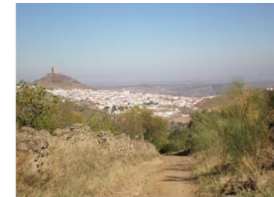
Camino de la Zorra

A través de un camino con fuerte pendiente divisaremos hermosos paisajes. Llegamos al Puerto La Zorra. En este punto tomamos un desvío a la izquierda, ladera arriba hasta coronar la sierra en el punto más alto llamado Mirrio.