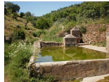
Pilar de Arriba

A unos 100 metros tomamos el desvío a la izquierda por el camino del Pilar de Arriba. Avanzamos por él, hasta encontrarnos con el Pilar de Arriba. Unos metros más adelante, encontraremos un cruce de camino, donde tomaremos el de la derecha o Camino de La Zorra.