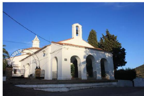
Ermita de los Mártires

A unos 100 metros tomamos el desvío a la izquierda por el camino del Pilar de Arriba. Avanzamos por él, hasta encontrarnos con el Pilar de Arriba. Unos metros más adelante, encontraremos un cruce de camino, donde tomaremos el de la derecha o Camino de La Zorra.