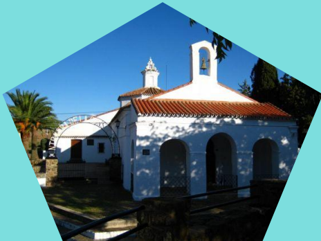
Ermita de los Santos Mártires